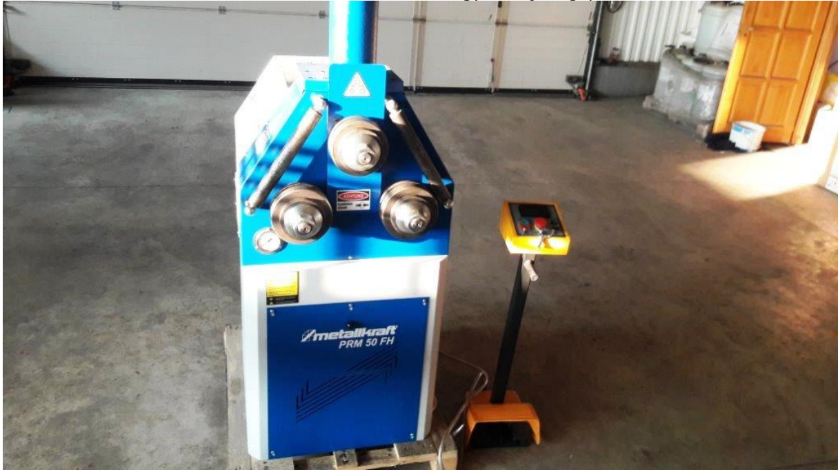
METALLKRAFT PRM 50 FH gyűrűhajlító gép