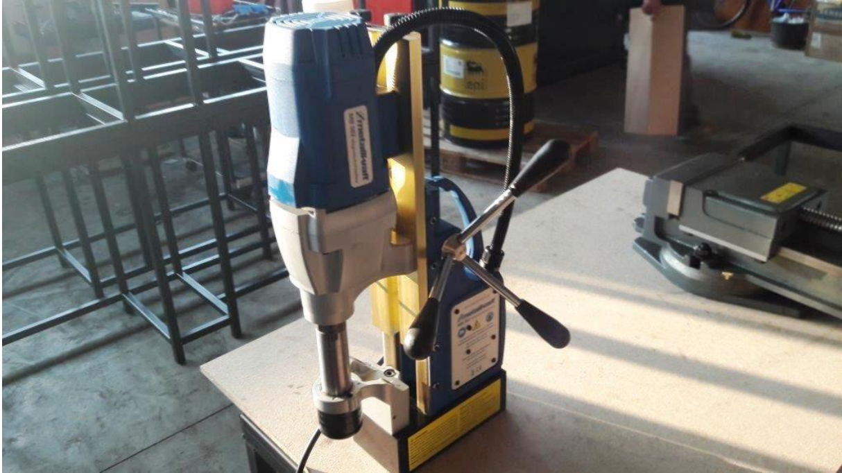
METALLKRAFT MB 502 mágnesalpas fúró