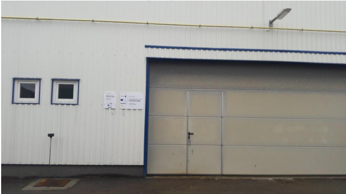
„C” és „D” tábla